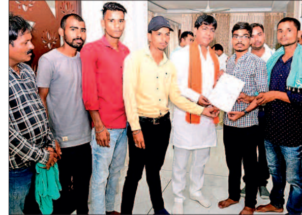
हरिभूमि न्यूज ►► महासमुंद