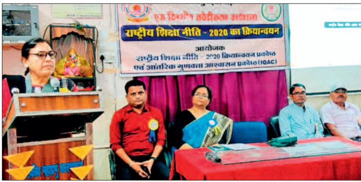
महासमुंद